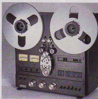
▲ 1976: RS-1506 – die legendären Bandgeräte mit „Omega Drive“ waren Objekte der Begierde. Der Preis damals: 1650 Deutsche Mark.