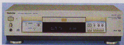
▲ 2000: DVD-A 10 – zur Jahrtausendwende startet Technics mit dem ersten DVD-Audio-Player. Es gab ihn auch in einer „Panasonic“-Version.