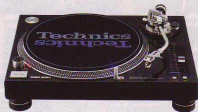
▲ 1972: Der SL-1200 – die Geburt einer Legende. Er wird rasch zum Liebling der DJs. Die 1200er-Serie wurde fast 40 Jahre lang produziert.