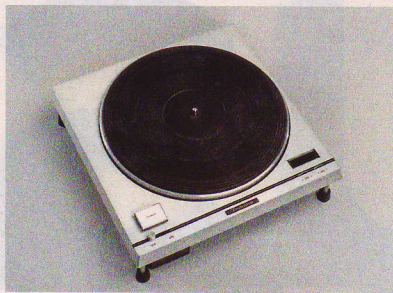
▲ 1970: SP-10 – der erste Plattenspieler mit Direktantrieb. Ein technologischer Durchbruch, aber in audiophilen Kreisen nicht unumstritten.

Auch wenn es heute den Anschein hat, dass die Konkurrenz aus Korea die Technologieführerschaft übernommen hat, so mischen japanische Unternehmen als Bauteile-Spezialisten und Experten für die Fabrikautomation noch kräftig mit.