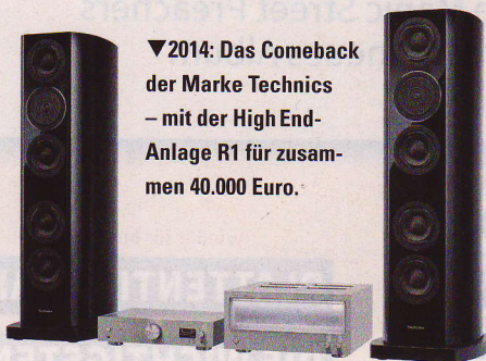
▼ 2014: Das Comeback der Marke Technics – mit der High End-Anlage R1 für zusammen 40.000 Euro.

Europa haben sie jedenfalls in vieler Hinsicht technologisch abgehängt.